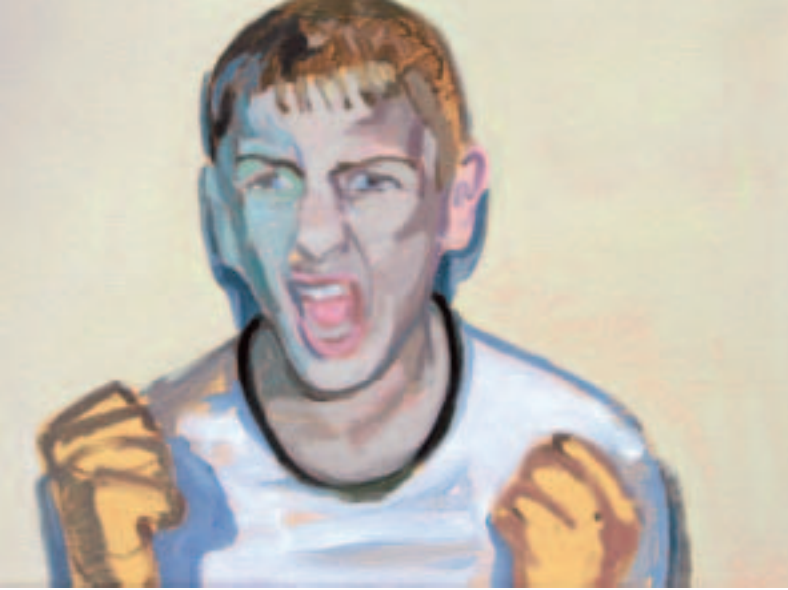
Zwei Bilder aus der Serie „afficere“